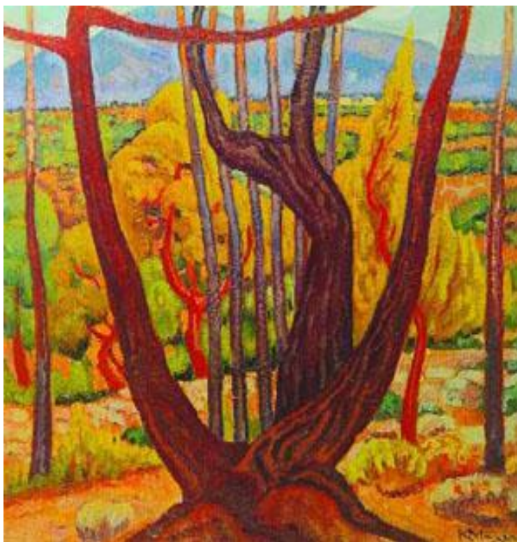
Κωνσταντίνος Μαλέας (1879-1928). Λύρα. Λάδι σε μουσαμά (50εκ X 54εκ.).