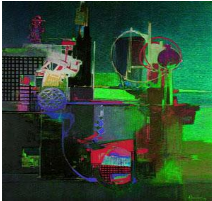
Αλέκος Κοντόπουλος (1905-1975). Σύνθεση, 1969. Λάδι σε μουσαμά (110εκ. X 100εκ.).