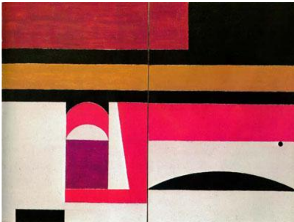
Γιάννης Μόραλης (1916- ). Επιθάλμιο, Δίπτυχο, 1974. Ακρυλικό σε μουσαμά (106εκ. X 146εκ.).