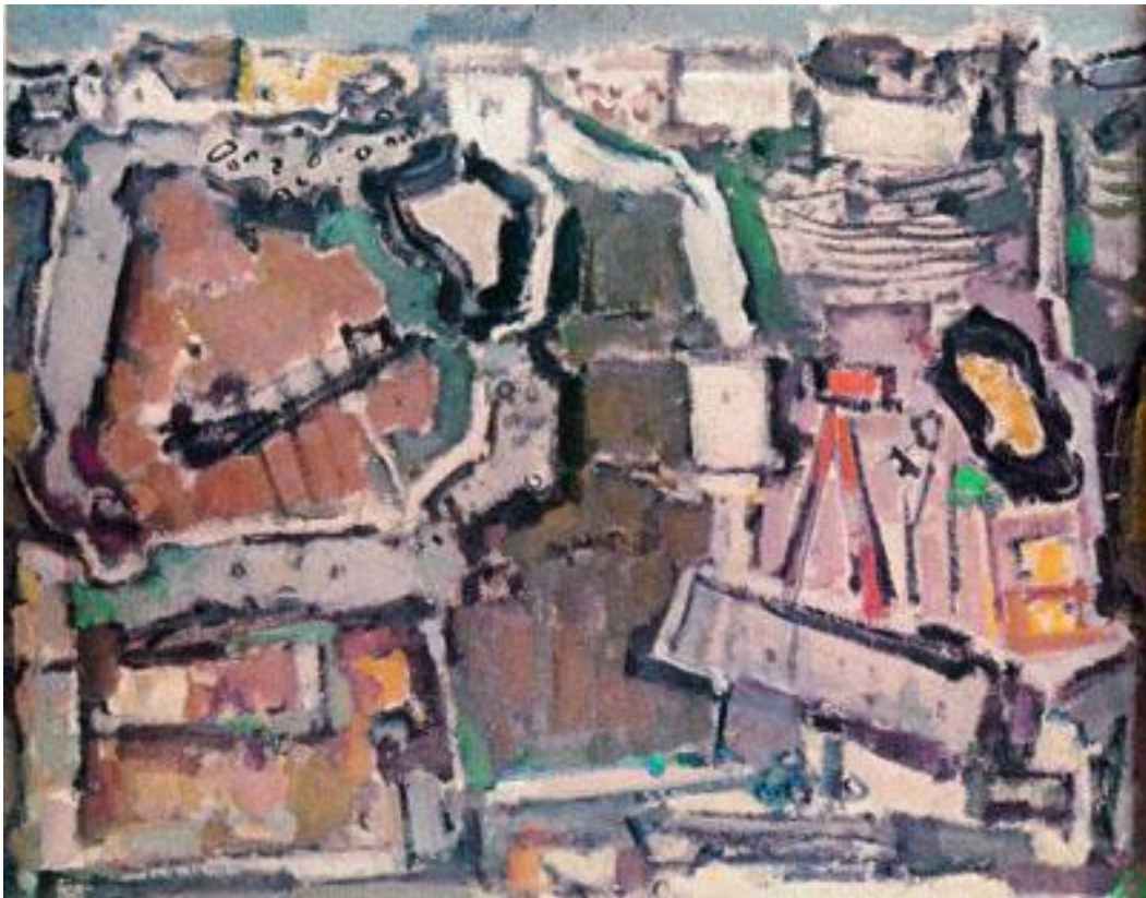
Γιάννης Σπυρόπουλος (1912- ). Ξερολιθιές Μυκόνου. Λάδι σε χάρντμπορντ (70εκ. X 90εκ.).