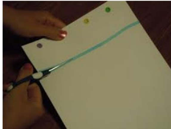
Παράδειγμα χρήσης οδηγού κοπής